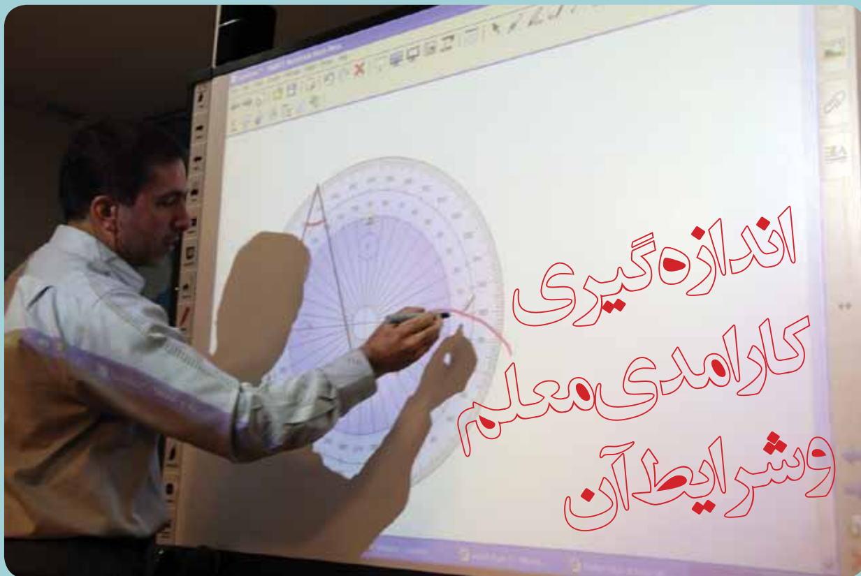
نویسندگان: سیرکو استامبو پیترمک والترز مترجم: محمدجعفر جوادی