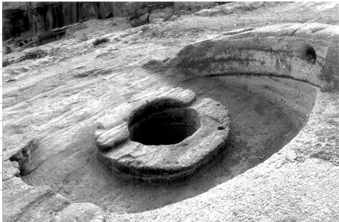
چاه‌های دره لیر

در قسمت شمال غربی سیراف تنگی وجود دارد که به تنگ لیر (لیل) معروف است. لیر از نام درخت بزرگی گرفته شده که در تنگه وجود داشته و به زمین‌های شیلاو مشرف است (معصومی،