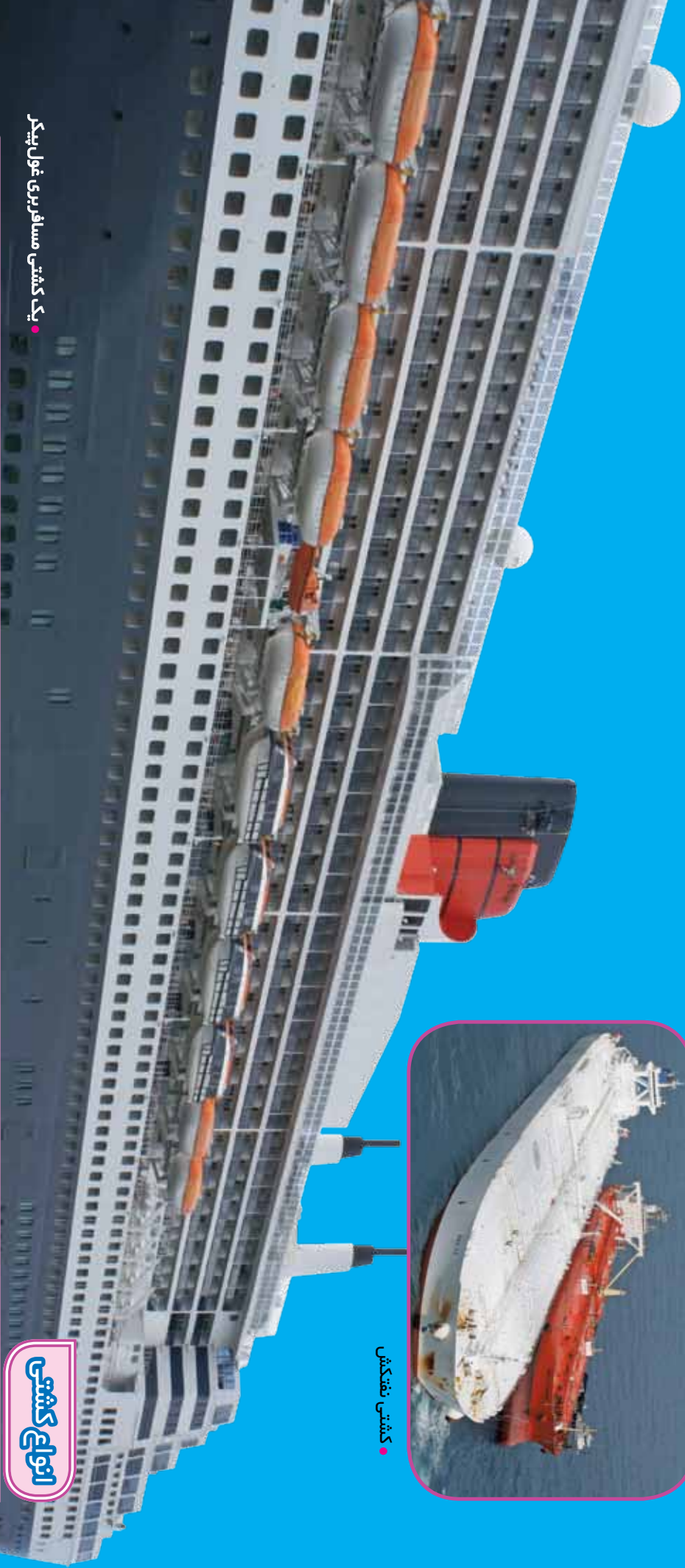
● یک کشتی مسافربری غول پیکر