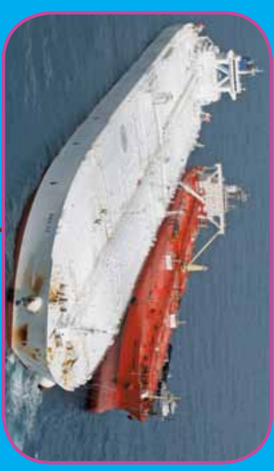
● کشتی نفتکش