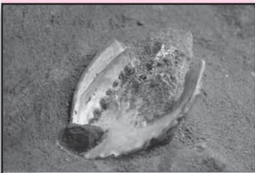
سفال باستانی رنگ

باستان‌شناسان در غاری واقع در آفریقای جنوبی ابزارهایی کشف کرده‌اند که نشان می‌دهند این غار در ۱۰۰ هزار سال پیش آزمایشگاه یک نقاش بوده است.