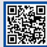
نمونه تدریس به روش قصه‌گویی