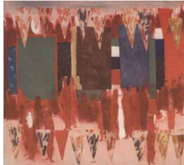
آنه محمدناتاری، بدون عنوان، ترکیب مواد روی پارچه، ۸۶×۹۵