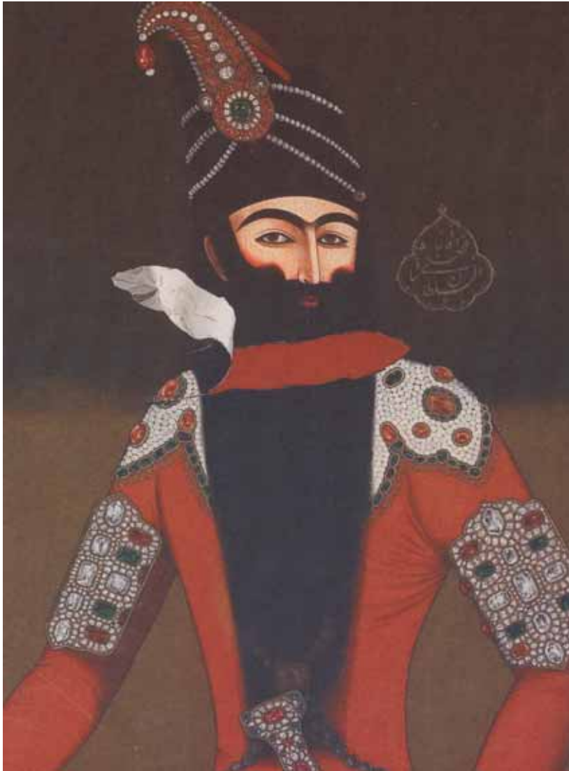
آیدین آغداشلو، خاطرات انهدام، گواش روی مقوا، ۵۶×۵۷، ۱۳۸۷

و هنرستان، حافظه بصری خود را با تماشای آثار چند نسل از نقاشان و اهل نقاشی خط پرورش دهند.