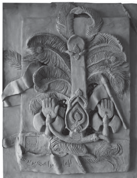
سفال یک پدیده چندوجهی است. نقاشی، مجسمه‌سازی و طراحی طبعاً در سفال‌سازی تأثیر دارند

غیرپیش‌بینی بودنش یک ظرفیت به‌خصوص در این زمینه دارد؛ یعنی بسیاری از سفال‌گرانی که زیاد کار کرده‌اند و تجربه خوبی نیز دارند و حتی برای کارهایشان چهارچوب‌هایی هم درست کرده‌اند، همه اعتراف می‌کنند که به قدری در خلق یک اثر هنری سفالی عنصر غیرمنتظره وجود دارد که باز ما به دفعات با یک پدیده غیرپیش‌بینی شده‌ای مواجه و از چهارچوب‌هایمان خارج می‌شویم. انسان نیز موجودی غیرقابل پیش‌بینی است. چون عوامل بسیار زیادی در شخصیت او اثرگذار است که امکان دارد تعدادی از آن‌ها را بشناسد و یا نشناسد.