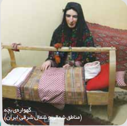
گهواره‌ی بچه (مناطق شمالی و شمال شرقی ایران)