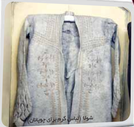
شولا (لباس گرم برای چوپانان)