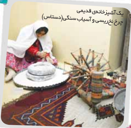
یک آتشیزخانه‌ی قدیمی چرخ نخریسی و آسیاب سنگی (دستاس)