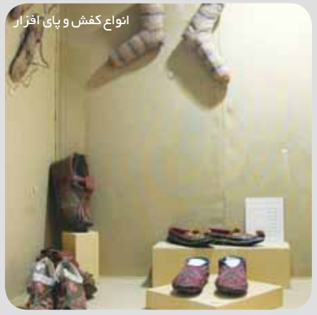
انواع کفش و پای افزار