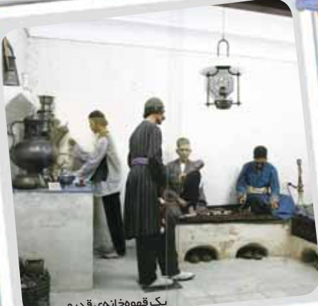
یک قهوه‌خانه‌ی قدیمی