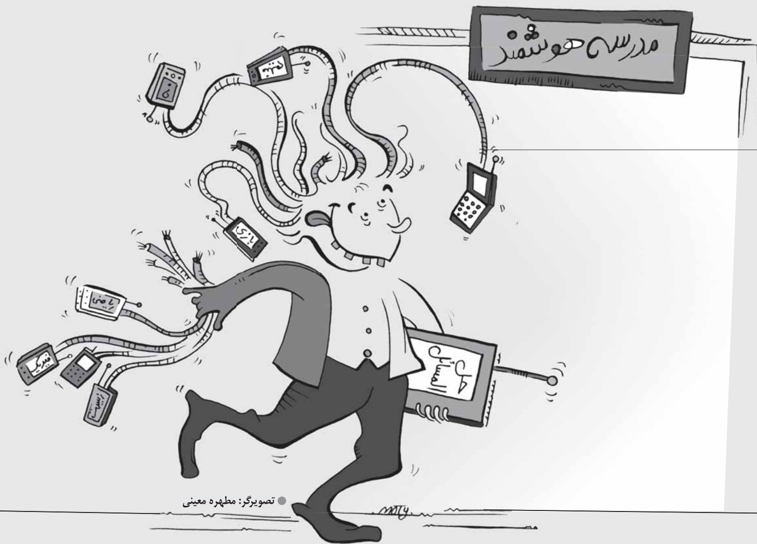
تصویرگر: مظهره معینی