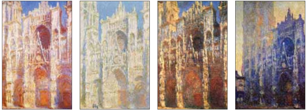
نقاشی بالا و صفحه روبرو: کلود مونه - مجموعه نقاشی از کلیسای روئن با هدف مطالعه حرکت نور و رنگ در معماری