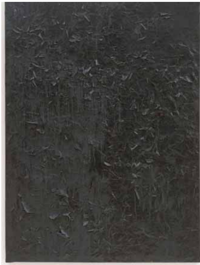
بدون عنوان، روبرت راشنبرگ

دوران خودنمایی آن فصل زمستان می‌باشد. زمانی که رشد و نمو طبیعت خاموش می‌شود و تمام جوانه‌ها در ظلمت خواب فرو می‌روند، رنگ آبی زندگی خود را آغاز می‌کند و جلوه و شکوه می‌یابد. آبی همیشه سایه‌دار است و میل دارد در تاریکی خودنمایی کند. همیشه نامحسوس است و در عین حال اتمسفر شفاف‌تری را نشان می‌دهد. آبی در جو