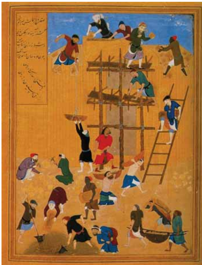
ساختن کاخ خورنق، اثر کمال‌الدین بهزاد

هستند و ارتباطات صحیحی برقرار می‌سازند و به‌ندرت کارهای احساسی می‌کنند. آن‌ها بسیار سیاستمدارند و در عین حال، افرادی دوست‌داشتنی هستند، از خصوصیات خود آگاه و از عشق و محبت و صبر سرشارند (مختاری، ۱۳۷۶: ۳۸-۳۷). رنگ آبی انسان را به سوی دقیق شدن در بی‌نهایت سوق می‌دهد و هر قدر روشن‌تر باشد، انعکاس موجی خود را از دست می‌دهند و به آرامش خاموش رنگ سفید می‌رسد (مقدسی، ۱۳۷۲: ۵۵). رنگی خالص است که نه نشانی از زرد دارد و نه اثری از قرمز. آبی