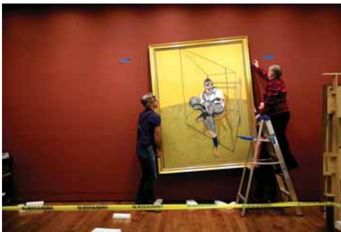
جایه‌جایی یکی از آثار فرانسویس بیکن، نقاش انگلیسی

خود در هنر وسیله پرقدرتی برای بیان و نشان دادن حالت‌های عمیق درونی است. در مورد کودکان تخیلات و حالت‌های عاطفی است که تعیین‌کننده انتخاب رنگ‌هاست نه حقیقت بیرونی (مختاری، ۱۳۷۶: ۳۹). بدون تردید، رنگ‌ها به‌عنوان محرک‌های محیطی اثر بسیار زیادی بر سیستم عصبی انسان دارند. تماشای رنگ‌های گرم، میزان ضربان قلب را تشدید می‌نماید و برای نمایش فضای پرهیجان کاربرد دارند. در میان رنگ‌های گرم، رنگ قرمز به قدری نافذ و سریع‌الحرکت است که از هر رنگ دیگری زودتر به چشم می‌خورد. رنگ‌های گرم تحریک‌کننده، سبب فعالیت و جنب‌وجوش، الهام‌دهنده روشنی، شادی، زندگی و مولد حرکت‌اند، درحالی‌که رنگ‌های سرد، برعکس، موجد حالت‌های انفعالی، سکون، بی‌حرکتی و تلقین‌کننده غم و اندوه می‌باشند (مقدسی، ۱۳۷۲: ۵۴-۵۵).