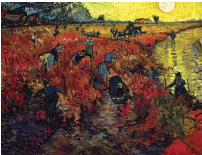
تاکستان قرمز، اثر ونسان ونگوک

می‌زنند و دنیا را مسئول ناراحتی‌ها و مشکلات خود می‌پندارند؛ خوشحال‌اند و زندگی را شیرین می‌دانند. دسته دیگر افرادی هستند که تظاهر به شجاعت می‌کنند. اگر کسی از رنگ قرمز بدش بیاید، احتمالاً عصبی و ناراحت و از دنیا بریده است (مختاری، ۱۳۷۶: ۳۸). اولین رنگی که کودک پیش از همه رنگ‌ها می‌شناسد، رنگ قرمز است. این امر به علت سرعت، شدت و تحرک عجیب آن است و بدین خاطر، با آن مأنوس شده، الفت پیدا می‌کند و آن را بیشتر از رنگ‌های دیگر دوست دارد. رنگ قرمز، رنگ آتش است؛ رنگ گرما و حرارت. از این رو نشان‌دهنده هیجانات و احساسات