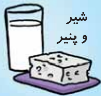
شیر و پنیر