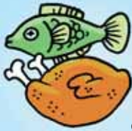
ماهی و مرغ