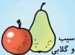
سیب و گلابی