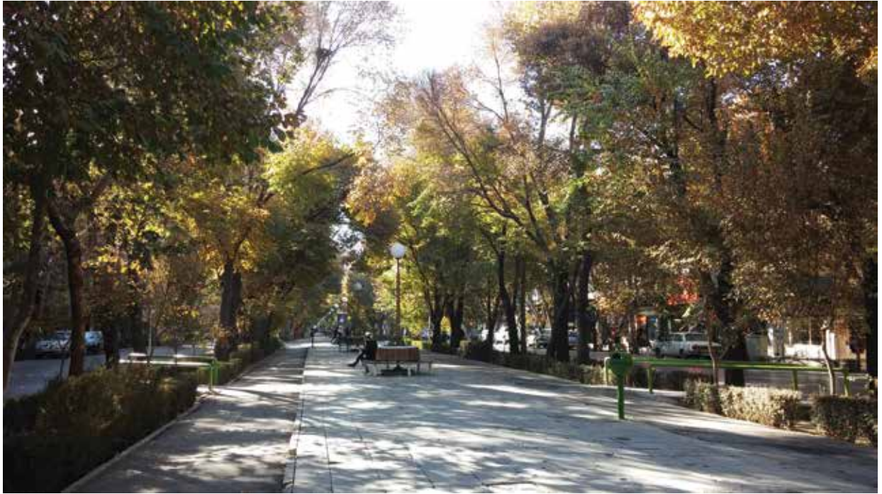
خیابان چهارباغ در زمان حال، نگارنده.