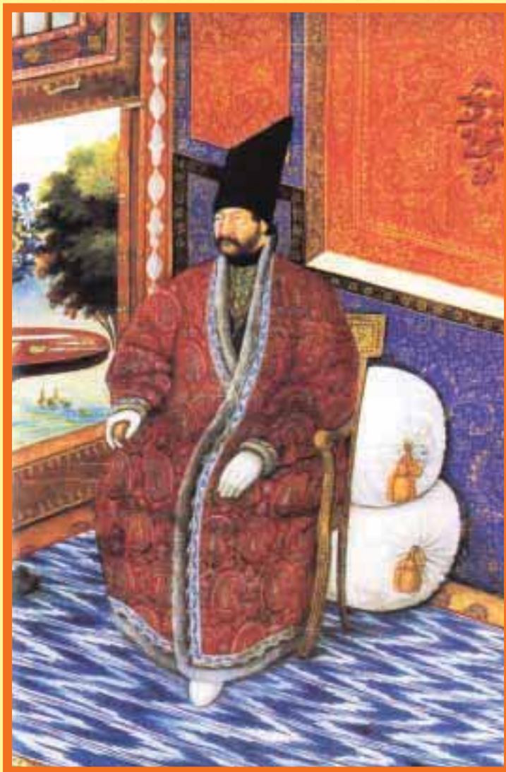
چهره اردشیر میرزا، تهران، ق. ۱۲۶۹ ه.ق