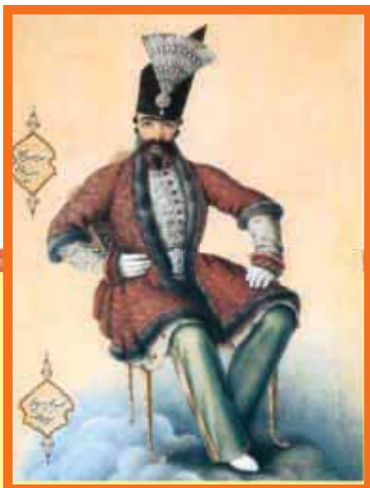
آبرنگ روی کاغذ ۲۴/۳×۳۲/۸ سانتی متر «رقم ابوالحسن غفاری نقاشباشی تحریر فی شهر رجب المرجب ۱۲۷۰» موزه لوور پاریس، بخش اسلامی MAO ۷۷۷