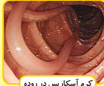
کرم آسکاریس در روده

است عفونت‌های شدید ایجاد کند. + ناراحتی‌های تنفسی