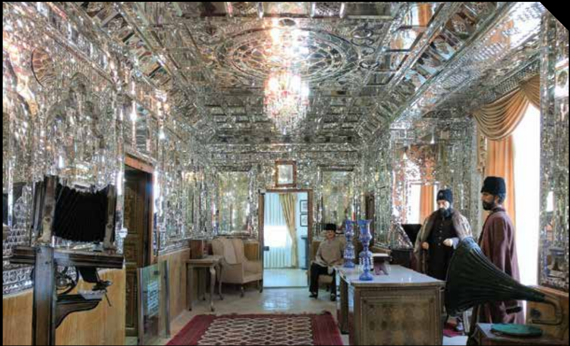
تصویر شماره ۳: تالار آئینه بنای آئینه‌خانه مفخم بجنورد

رضاشاه این کتیبه از سردر بنا جدا شده و به جای آن کاشی کاری فعلی نصب شده است. فضای فرورفته بین نیم‌ستون‌های ایوان یا به عبارتی طاق‌دیس نیز بعضاً با کاشی‌های لوزی شکل به رنگ‌های زرد سفید و فیروزه‌ای و آبی مشبک، طرح زیبایی را در بنا ایجاد کرده‌اند. در بخش تحتانی طاق‌دیس‌ها طاقچه‌ای به ارتفاع حدود ۲ متر دارای پایه‌ای پوشیده از سنگ مرمر وجود دارد. قسمت داخلی این طاق با کاشی هفت‌رنگ زرد لاجوردی و حاشیه‌ای به رنگ سیاه تزیین شده است. در قسمت بالای این طاق روی یک کتیبه لاجوردی مملو از نقوش اسلیمی منازعه گاو و شیر نقاشی شده است که به یاد شیر و گاو حک شده در حجاری دیواره‌های تخت جمشید است (این نقوش نشان می‌دهند که معمار دچار دوگانگی شده اما هنوز پایبند سنت‌ها و عقاید ملی خویش است و آن‌ها را بی‌پروا در بنا به نمایش می‌گذارد تا بتواند سهمی در حفظ اصالت و فرهنگ خویش داشته باشد). این عمارت تنها نمادی از روح خلاق هنرمند ایرانی است و تنها دست توانای هنرمند ایرانی با استعانت از هنر معماری نقاشی، کاشی‌کاری و آئینه‌کاری قادر به خلق چنین ترکیب بدیعی است. در واقع با صیانت از آثار تاریخی، هنرمندان و هنری