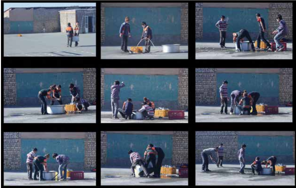
۲. نمونه‌ای از مجموعه عکس

بسیاری از عکاسان آگاهانه به سراغ یک سوژه می‌روند و از پیش‌طرحی را برای تولید و انتشار آن در نظر می‌گیرند