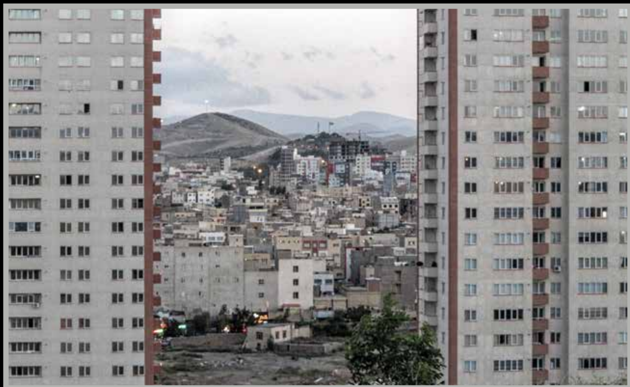
۵. ثنا توکلی، اثر برگزیده بخش دانش‌آموزی دوره نهم جشنواره عکس رشد.