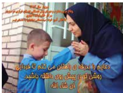
عکسهای ۷ تا ۹: حک کردن واترمارک روی عکس