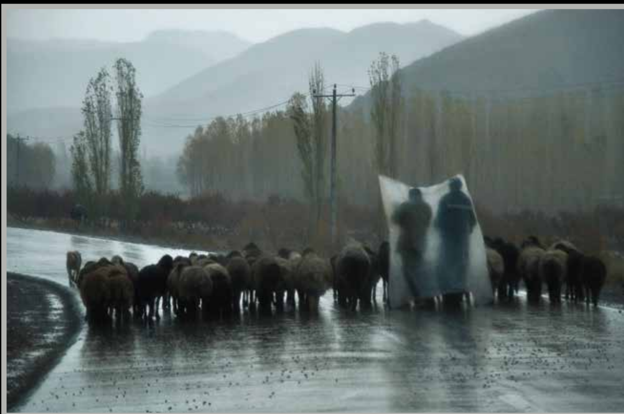
۴. اردلان حسن علی‌زاده، عکس راه‌یافته به بخش دانش‌آموزی دوره هشتم جشنواره عکس رشد.