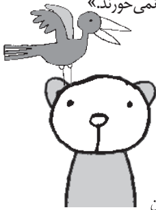
شخصیت‌های اصلی و فرعی داستان