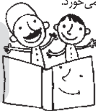
حوادث و رویدادها