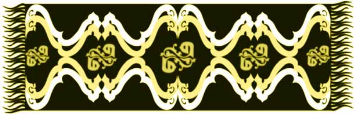
نمونه‌ای از کار عملی انجام شده (شال شقایق)

۴. محافظ بدن از صدمات جنگ و بلاها و سختی‌ها و خطرات: «تقیکم بأسکم» (نحل / ۸۱). این پوشش شامل زره و لباس‌های محافظ امروزی در برابر خطرات شیمیایی و هسته‌ای نیز می‌شود. از همان ابتدای خلقت، در داستان حضرت آدم (ع)، پوشش و تمایل بشر به پوشاندن عورت خود، از سوی قرآن کریم مورد اشاره قرار گرفته و از آنجا که این بیان در قرآن کریم تکرار شده است، ذهن آدمی را به اهمیت خاص آن متوجه می‌سازد. درسی را که خداوند از ماجرای حضرت آدم بیان می‌کند در دو آیه ۲۶ و ۲۷ سوره اعراف آمده است، که همان لباس تقواست. مسلماً بهترین زینت معنوی انسان تقواست. تقواست که سبب پیشرفت معنوی انسان می‌شود. او را از گناه و سختی عذاب محافظت می‌کند و عیوب و نقایص وی را با پوشش و حسن تقوا می‌پوشاند. اسلام نظام عفاف و پاکدامنی را در مجموعه‌ای از قوانین پایه‌ریزی می‌کند، به طوری که توجه به یک حکم و نادیده گرفتن سایر احکام آن اهداف مقدس عفاف و پاکدامنی را در جامعه عقیم و ناکارآمد می‌سازد.