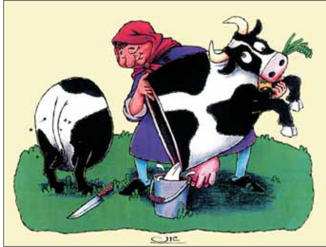
بهره‌وری در تولید شیر