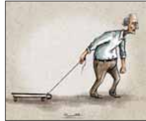
پیری و هزار دردسر