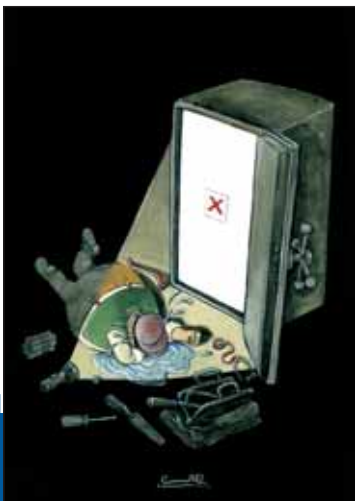
دزد بدشانس در دنیای رایانه‌محور امروز