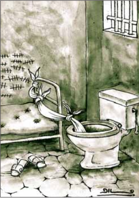
فرار از زندان