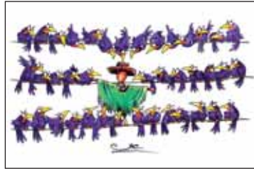
غریبه در میان جمع