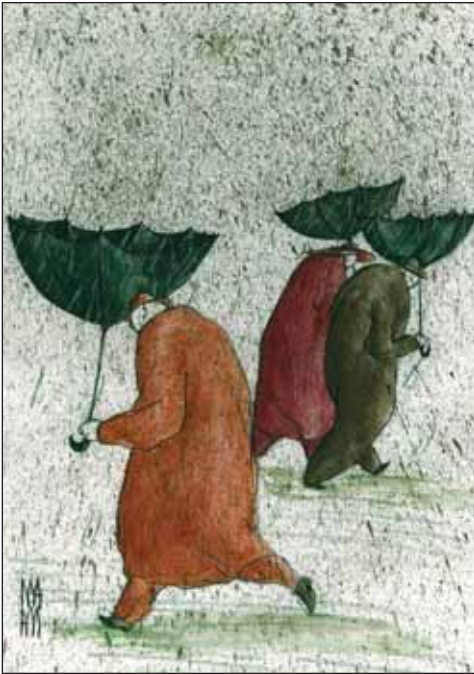
مصرف بهینه و ذخیره آب