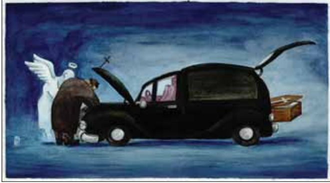
حس نوع دوستی و تعهد