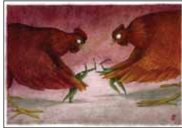
جنگ بی پایان