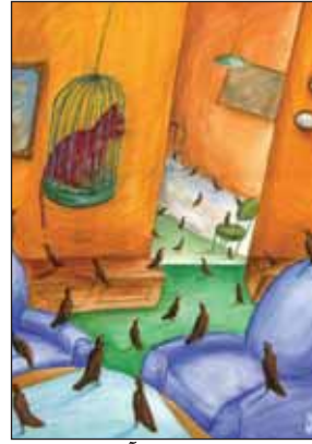
آن روی زندگی