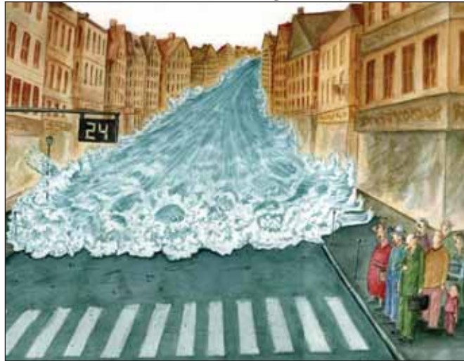
احترام به حق تقدم