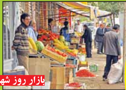
بازار روز شهر

بنای این برج هشت ضلعی که ارتفاعی به طول هشت متر دارد به قرن هفتم و هشتم منسوب می شود.