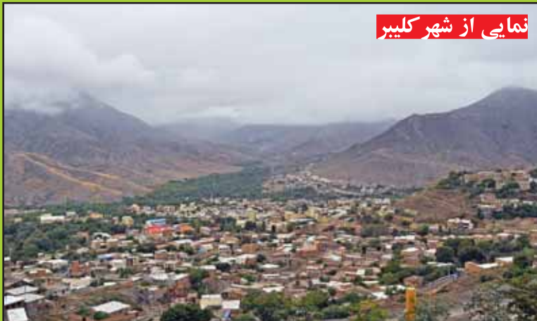
نمایی از شهر کلیبر