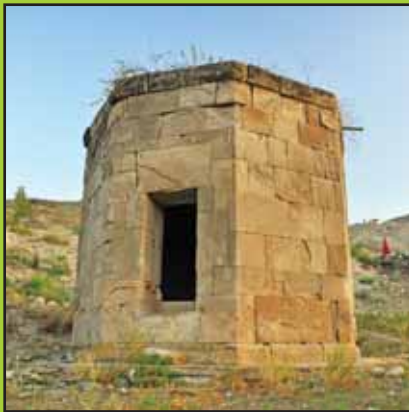
برج خان باغی

بنای این برج هشت ضلعی که ارتفاعی به طول هشت متر دارد به قرن هفتم و هشتم منسوب می شود.