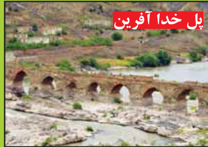
پل خدا آفرین