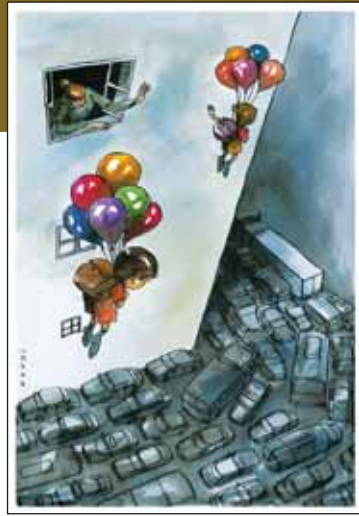
دیگه دیر به مدرسه نمیرسم