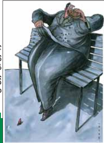
زمانی که نان گران شد...