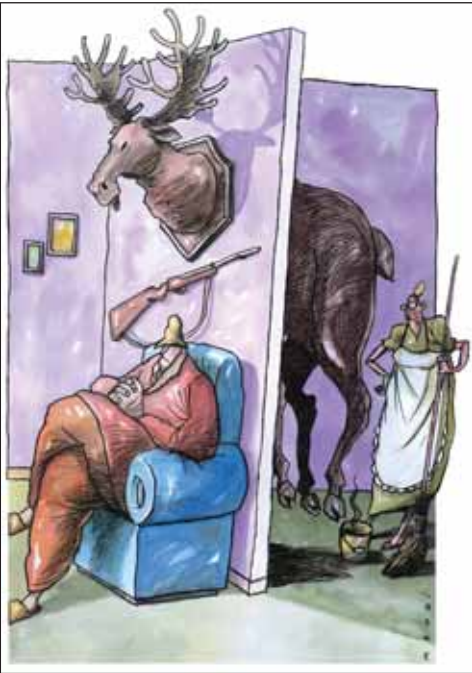
بهترین ها همیشه مال منه!