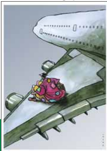
دور دنیا با جیب خالی