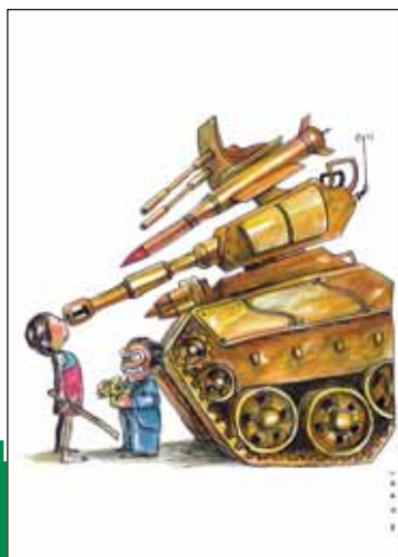
بازی‌های بچه‌گی فراموشمان شده