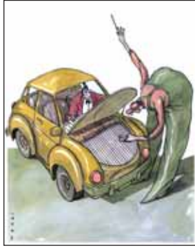
ماشین من، زندگی من