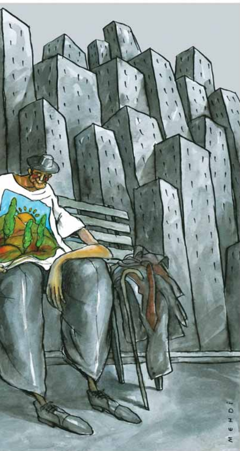
دل‌م‌برای آسمان آبی تنگ شده بود

موضوع کارهای او بسیار ناب و البته کمی خاکستری است. بیشتر آثارش مفاهیم با ارزشی دارند که البته مخاطب به آسانی آن‌ها را درک می‌کند.