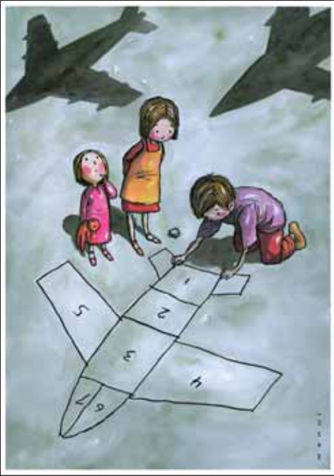
جنگ هم در بازیمان دخالت کرد