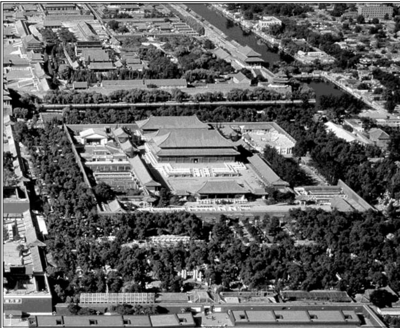
نمای شهر ممنوعه