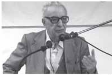
استاد پرویز شهریاری از دوم آذر تا ۱۲ تیرماه ۱۳۹۱ در تهران. او بیست و دوم کتیبه‌بند ۱۳۹۱ تیرماه ریاضیات، روزنامه نگار فعال ادبیات، پژوهشگر تاریخ علوم و - ایمان ریاضی از «مؤلفان ایرانی شهر کرمان» ایمان ریاضیات از دانشکده علوم دانشگاه تبریز ایمان دبیری از دانشکده علوم دانشگاه تبریز و گری انتقادی ریاضیات از دانشکده کرمان دانشکده نشان در به یک علمی از وزارت فرهنگ انتخاب به عنوان برترین ریاضی‌دان زنده ایران از سوی انجمن ریاضیات ایران برنده جایزه خیره ماندگار در رشته آموزشی ریاضیات فرهنگ نویسی، دانشنامه نویسی، مؤلف و مترجم بیش از چهل‌صد کتاب در زمینه های ریاضیات، فلسفه، تاریخ و ادبیات نویسنده بیش از ده هزار عنوان مقاله در مجله‌ها نظیر مجله علمی و فرهنگی سرزمین نشانیات منطقه‌ها و علوم، علمی طنز و هنر، مسائل دانشکده‌های آشنایی با دانش آشنایی با ریاضیات آشنایی با ریاضیات دانش و مردم... و همکاران چندی در مدرسه، دانشکده و موسسات علمی، آموزشی و فرهنگی

بوده] است، تقریباً از قرن سوم هجری شمسی تا قرن نه انهم، یعنی ۶۰۰ سال، سردمدار علم جهان بوده است. در این دوره دانشمندی داریم و چنان پیشرفت کرده بودیم که هیچ کشوری از نظر علمی نمی توانست با ایران رقابت کند. ● صحنه‌های دیگر به تصویری از این استاد فرزانه اشاره دارد که در زیر آن این جمله نقش بسته است: «کنکور با این وضعی که امروز در مملکت ما هست، دانش مملکت را ویران می‌کند.» (پرویز شهریاری) ● در صحنه‌های دیگر شهریاری در مورد انواع مدارس که در کشور ایران وجود دارند، مانند مدارس