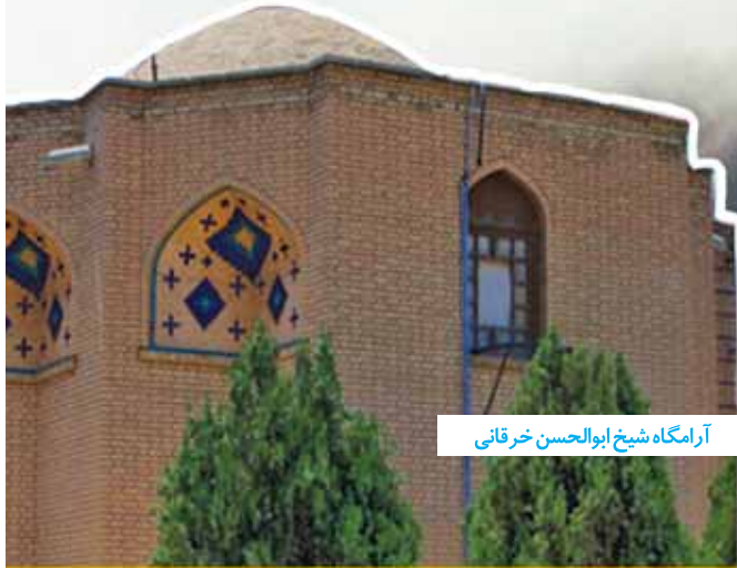
آرامگاه شیخ ابوالحسن خرقانی

این بار قصد سفر به بسطام، شهری کوچک در شش کیلومتری شهرستان شاهرود در استان سمنان را داریم. شهری آرام با چنارهای تنومند که مانند نگینی در دامنه‌های البرز شرقی خودنمایی می‌کند. گفته می‌شود این شهر را حاکم خراسان (بسطام نام) بنا کرده است که دایی و سردار سپاه خسرو پرویز ساسانی بوده است. از سفالینه‌های یافت شده در دل تپه‌ای معروف به سنگ چخماق - در شمال بسطام - قدمت این سرزمین را ۸۰۰۰ سال تخمین می‌زنند. این شهر از قرن سوم تا اواخر دوره قاجاریه از مراکز مهم فرهنگی بوده است. بسطام زادگاه عارفانی مانند بایزید بسطامی، شیخ ابوالحسن خرقانی و فروغی بسطامی است و ... به این دلیل شهر عارفان لقب گرفته است.